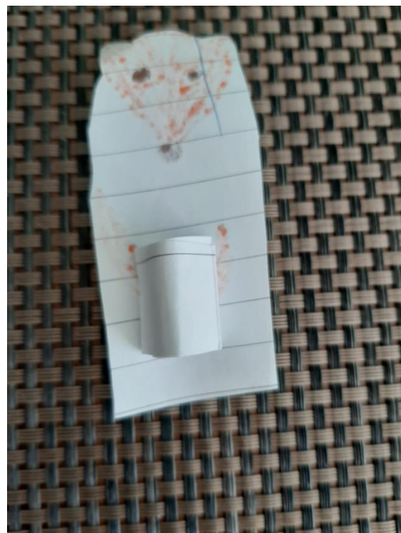
SLIKA 2: ZANKA ZA PRST – LUTKA OD ZADAJ