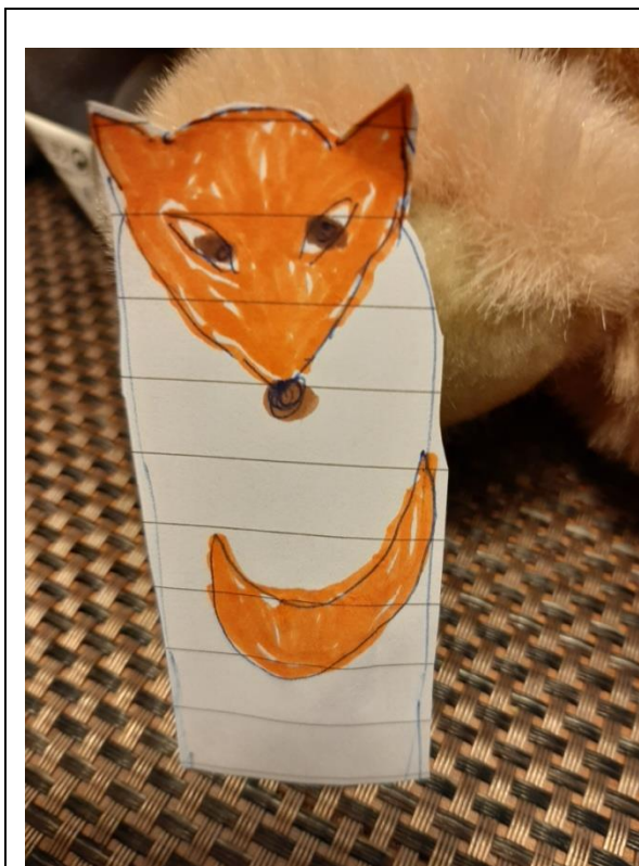
SLIKA 1: LUTKA IZ PAPIRJA ZA NA PRST OD SPREDAJ