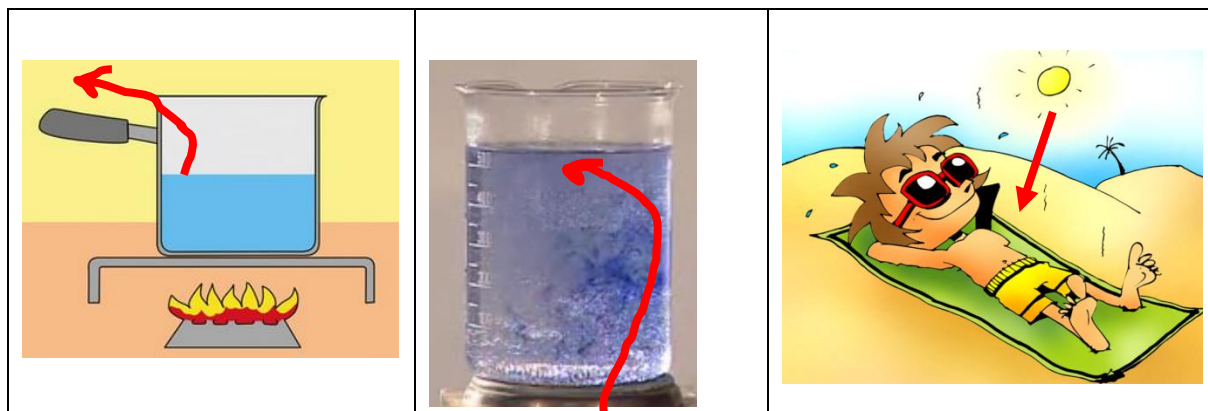
Prikaz konvekcije v vodi:

Hitrost prevajanja toplote je odvisna od vrste snovi in od velikosti telesa .