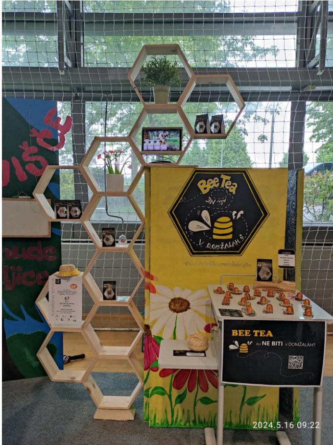
Projekt Turizmu pomaga lastna glava