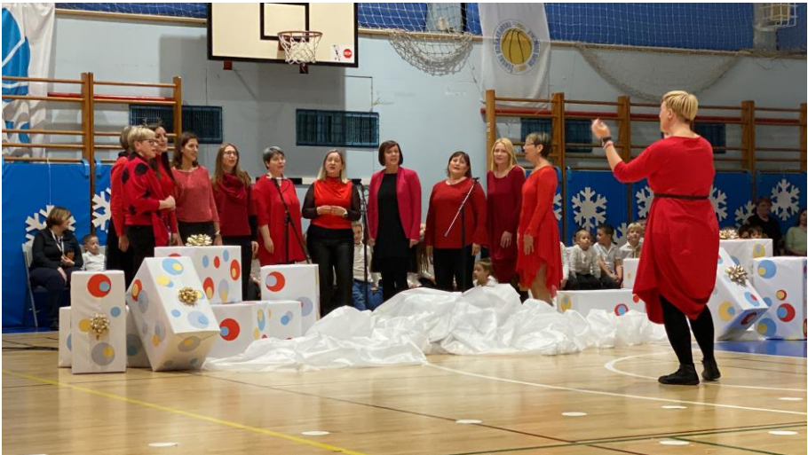
Venceljeve Perke – Muzikal Sreča za Snežno kraljico