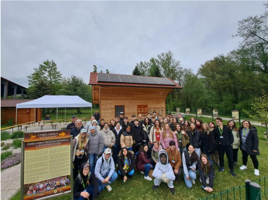
Erasmus Eco Art izmenjava