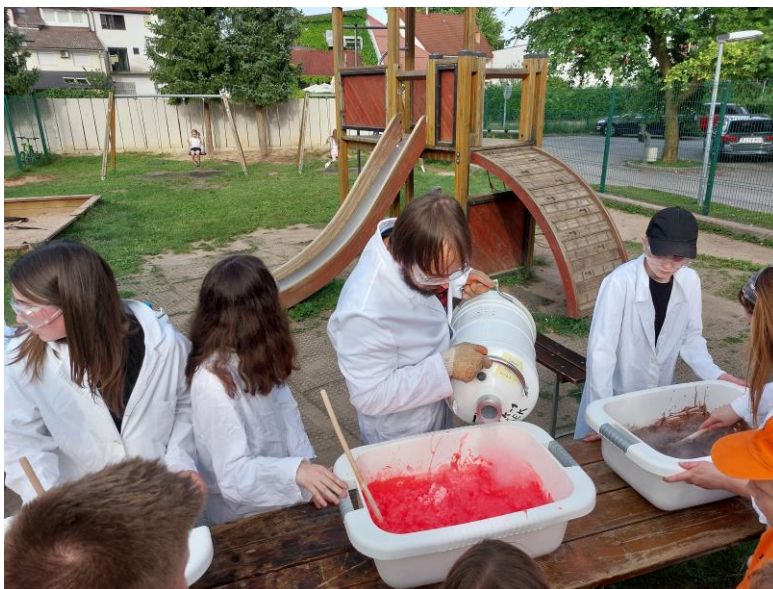
Kemijski poskusi – Adijo, šola!