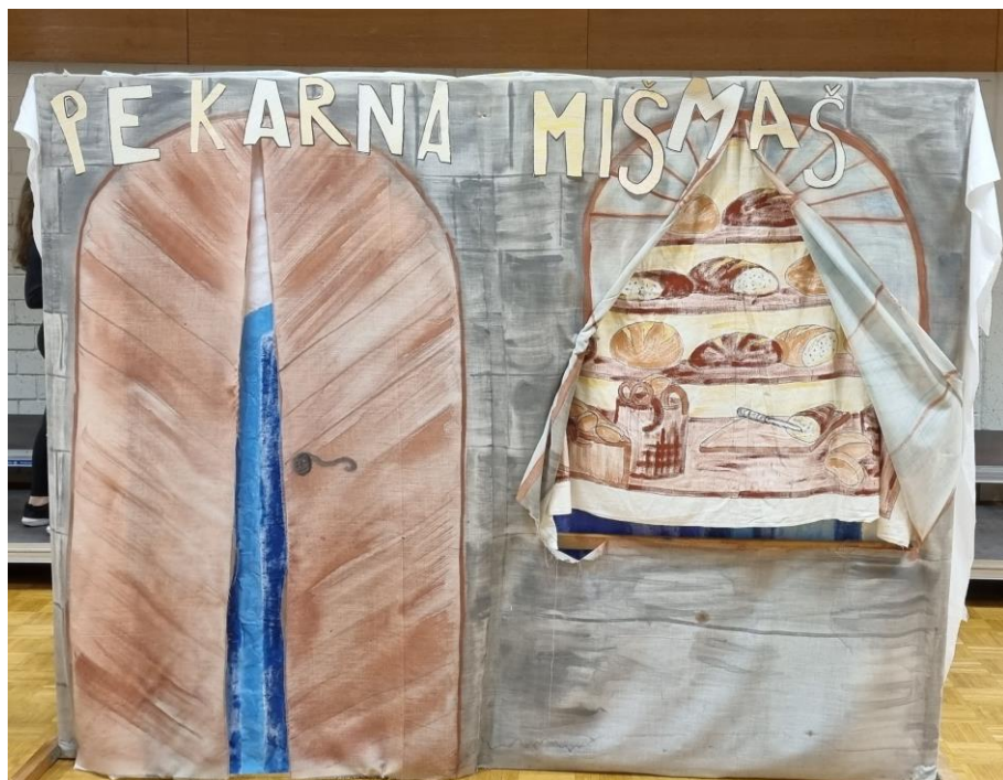
Pozdrav pomladi: Pekarna MišMaš