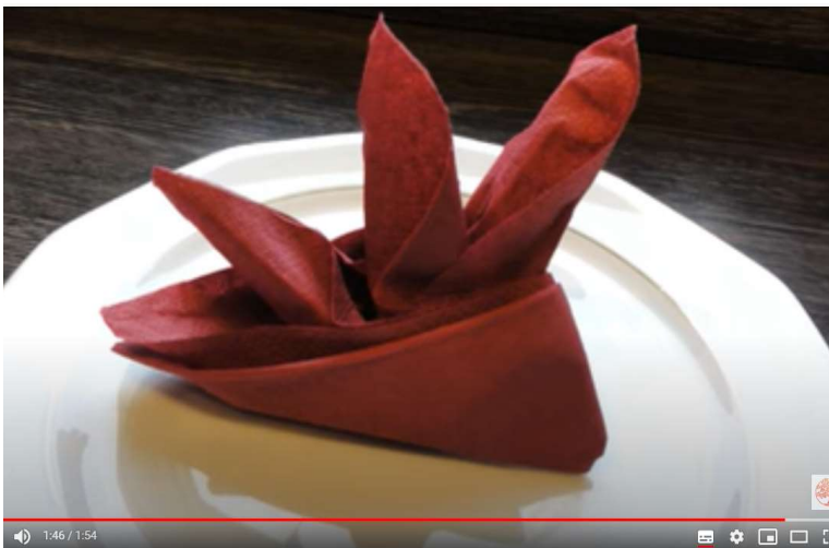
n - Napkin folding - Zlaganje serviet

prtiček, ki spominja na okrasno rastlino z velikimi cvetovi)