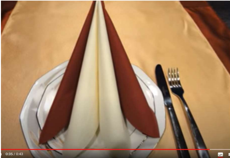
Napkin folding - Zlaganje serviet