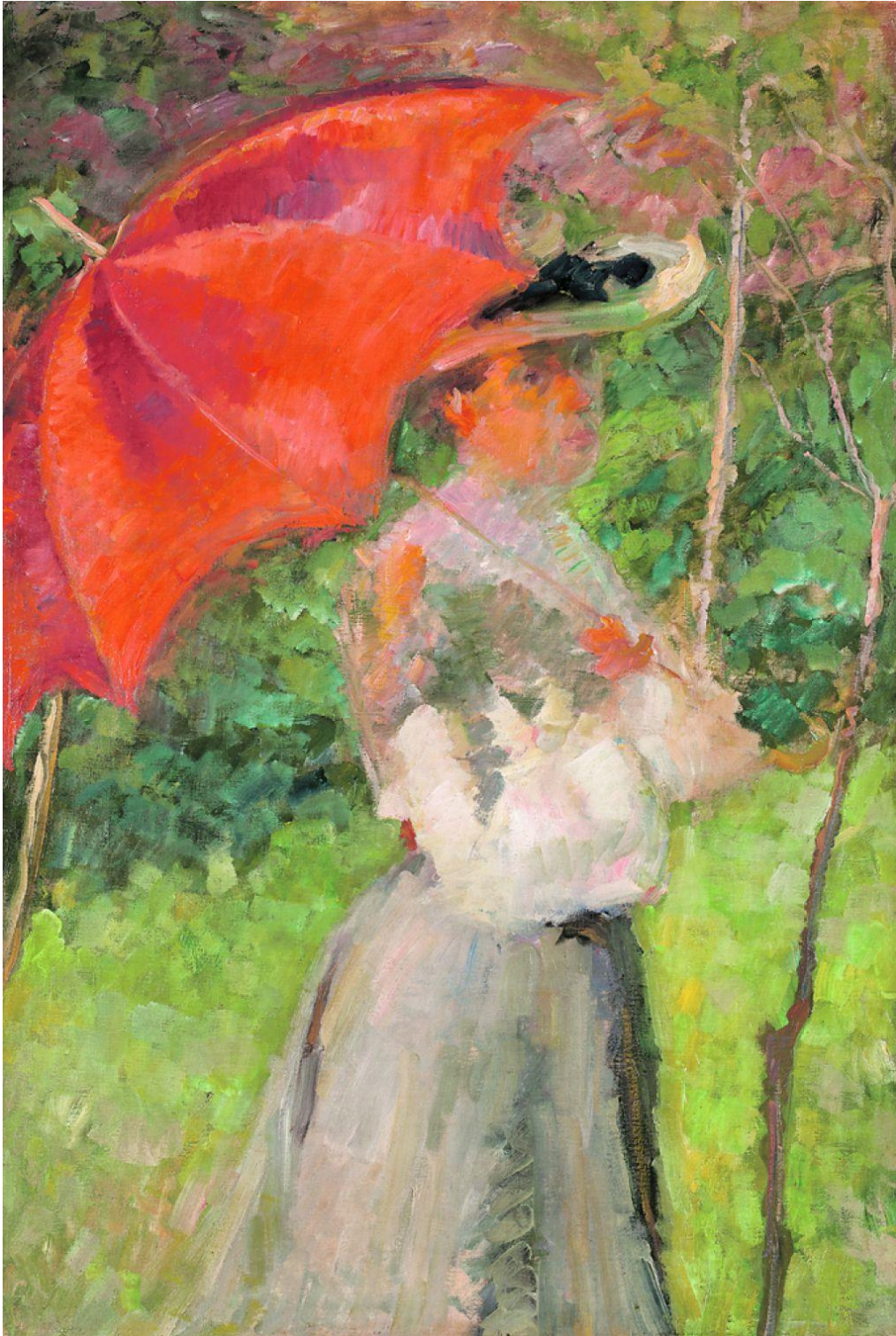
Matej Sternen: Rdeči parazol

Pri tej nalogi lahko izbirate med dvema možnostima: