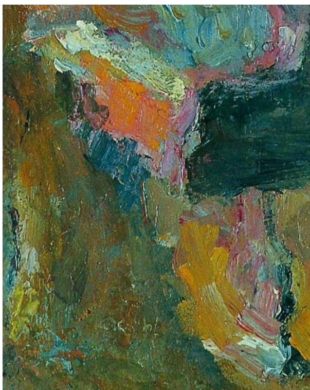
Rihard Jakopič: Pri klavirju (detajl)

Če gledamo impresionistične slike od blizu, ugotovimo, da izgledajo pravi zmazki. Moramo se oddaljiti, da lahko razpoznamo, kaj slika predstavlja.