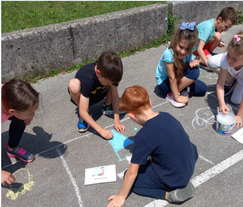
SLIKA 1 – Polja za Ristanc so narisana. Učenci so pričeli z risanjem čustev oz. počutij.