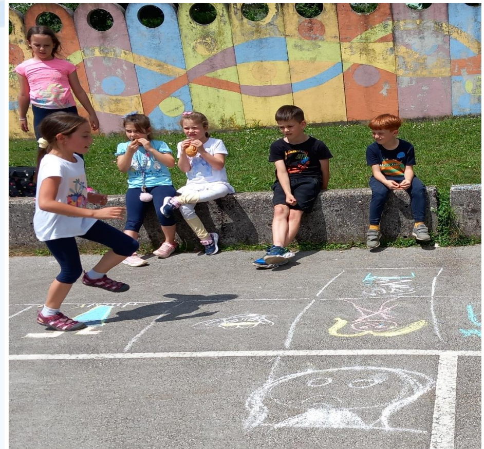
SLIKA 6 – Angleške urice smo povezali z Zdravo šolo. It was fun, we had a great time together! We learned and played a lot.