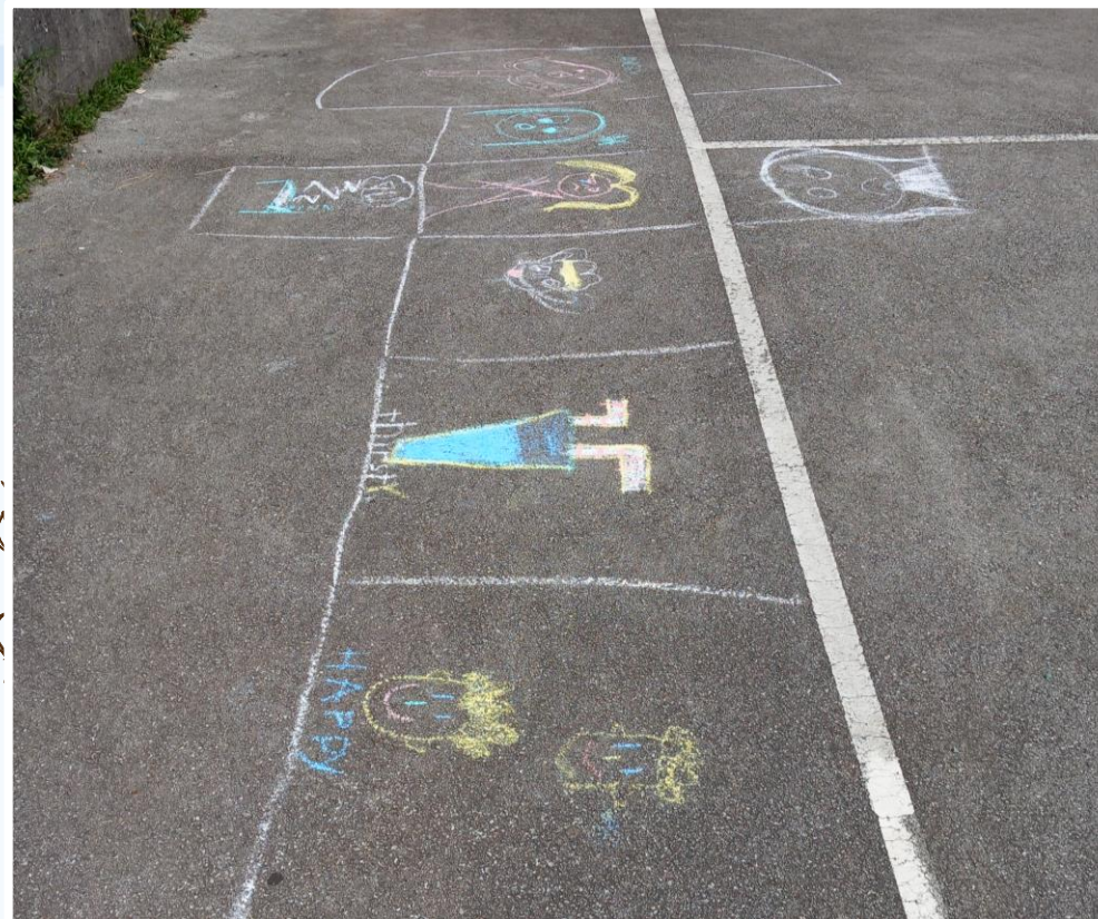
SLIKA 3 - Učenci s kredami rišejo različna čustva in počutja.