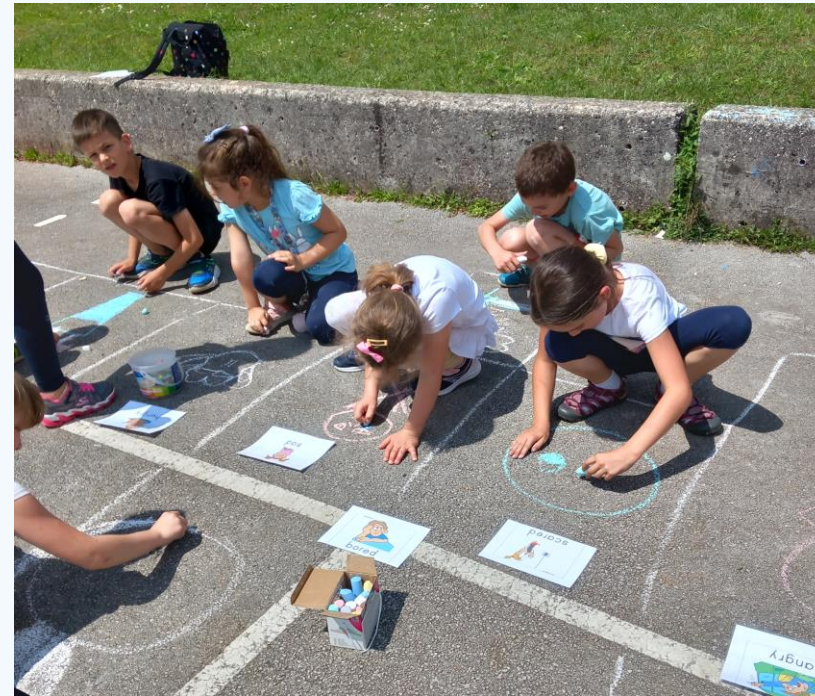
SLIKA 2 – Učenci si pri risanju čustev oz. počutij pomagajo s slikovnimi karticami – English flashcards – Feelings and emotions.