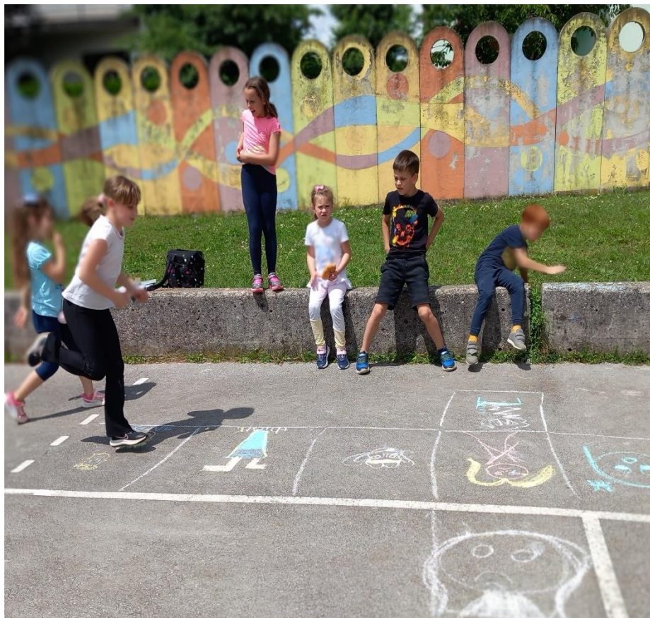
SLIKA 5 – Takole je izgledala naša igra. Let's play and learn!