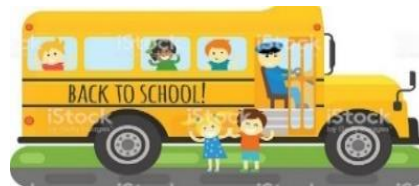
A SCHOOL BUS