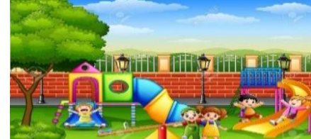
A SCHOOL PLAYGROUND