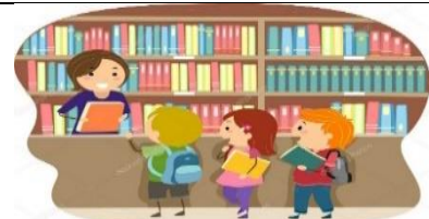
A SCHOOL LIBRARY