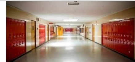
A SCHOOL HALL