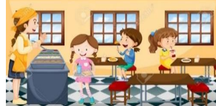
A SCHOOL LUNCH ROOM