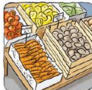
ZABOJČKE ODPELJEMO V TRGOVINO.