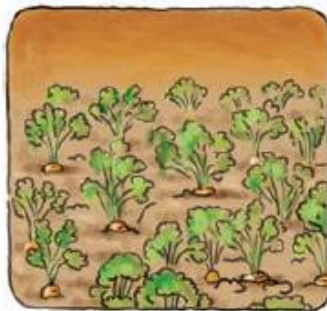
IZ SEMENA ZRASTE RASTLINA.