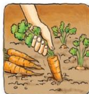
KO JE RASTLINA DOVOLJ VELIKA, JO IZPULIMO.