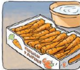
KORENJE OPEREMO IN ZLOŽIMO V ZABOJČKE.