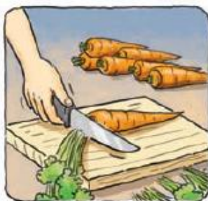
ZELENI DEL RASTLINE ODREŽEMO.