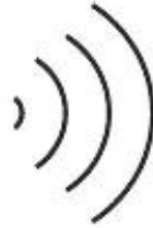
ZVOK SE ŠIRI, ČEPRAV GA NE VIDIMO.