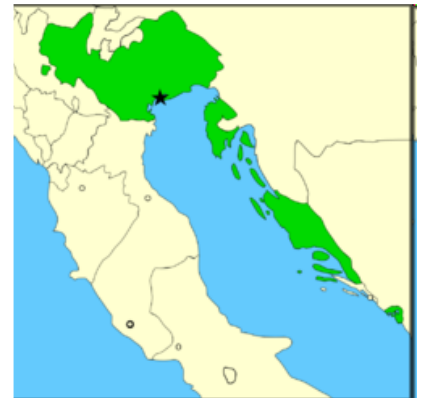
Zemljevid beneške republike, ki je obstajala od 697 – 1797.