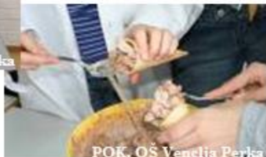
POK, OŠ Venclja Perka