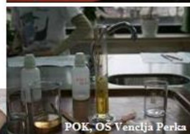
POK, OŠ Venclja Perka

TIP: To je enoletni predmet . Izberejo ga lahko učenci 8. in 9. razreda .