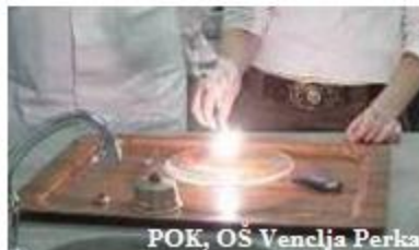
POK, OŠ Venclja Perka