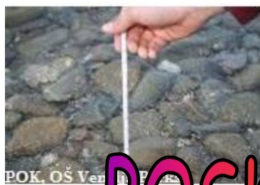
POK, OŠ Venclja Perka