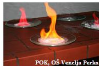
POK, OŠ Venclja Perka