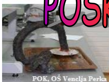
POK, OŠ Venclja Perka