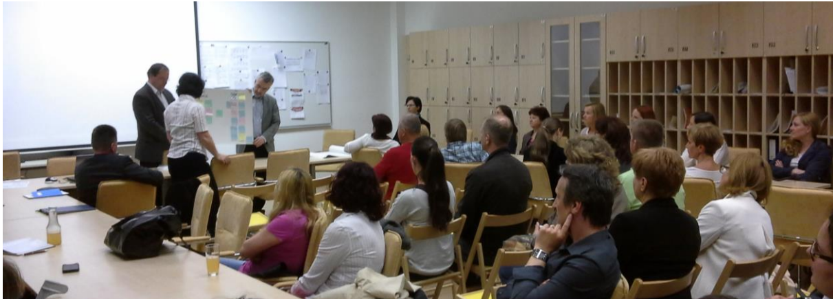
Poročilo rožnate delavnice