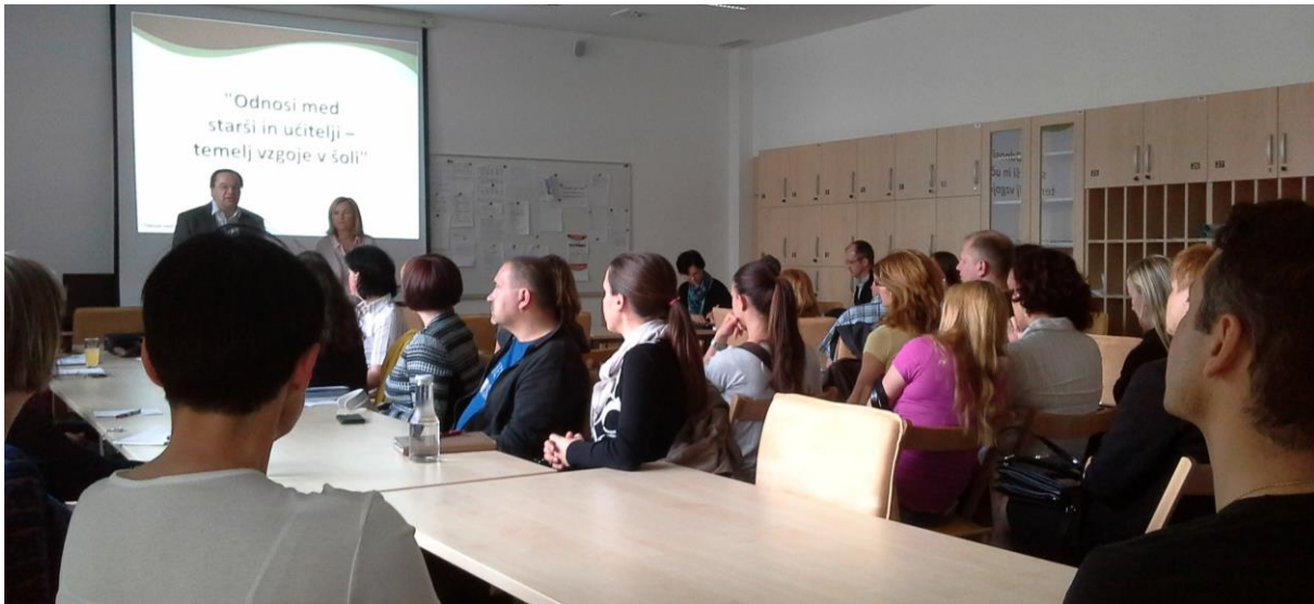
Skupni uvod v delavnice

Posvetovanje je potekalo v obliki delavnic, na katerih smo starši, učitelji in ravnatelji izmenjali mnenja o različnih izkušnjah medsebojnih odnosov, o željah in možnostih, kako te odnose izboljšati, ter o dobrih praksah, ki so lahko temelj sodelovanja v prihodnje. V nadaljevanju so navedeni povzetki vseh štirih delavnic.