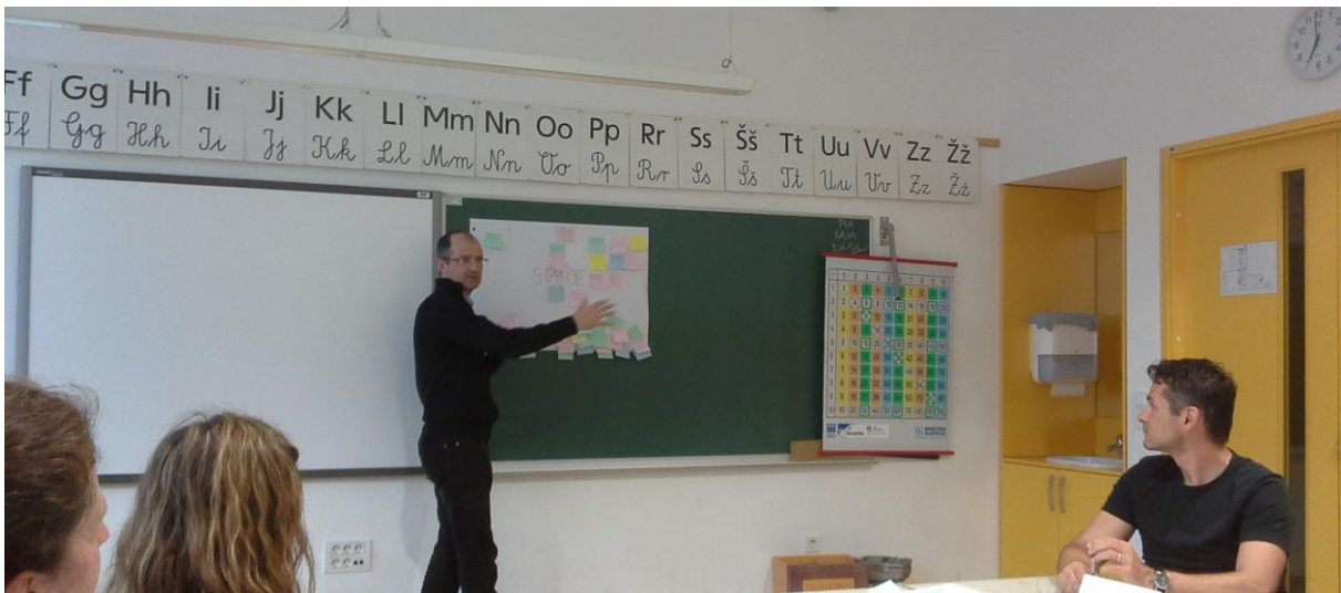
Poročilo zelene delavnice

Dejavnosti, ki pozitivno vplivajo na medosebne odnose na šoli so številčne, posebej bi poudarili tiste, pri katerih so aktivno udeleženi vsi deležniki. Občutek, da vsak lahko prispeva za skupno dobro je tisti, ki žene naprej, ki motivira ljudi za aktivnosti in rezultat skupaj načrtovanih, izvajanih in evalviranih aktivnosti je najslajši.