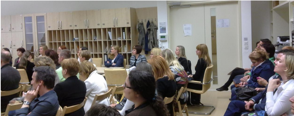
Zaključni del, zbrano poslušanje poročil