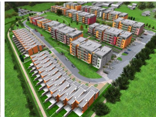
spalno naselje Lavrica