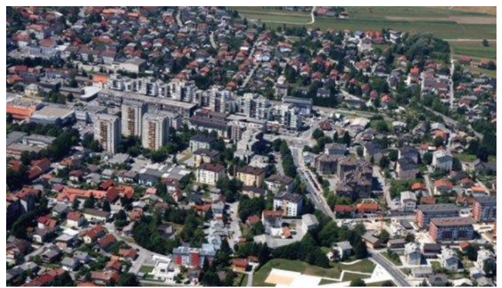
mlado mesto Domžale