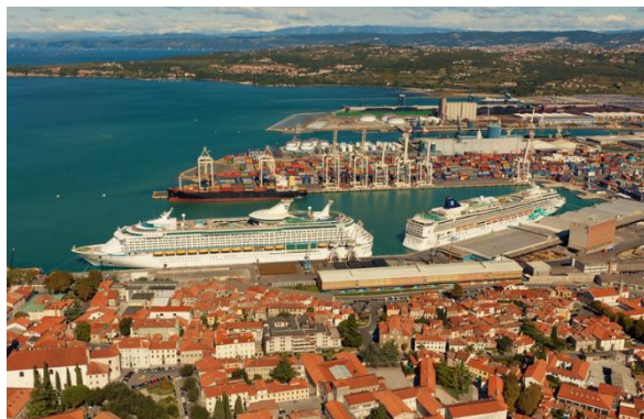
pristanišče Luka Koper

→ Preberi še besedilo v učbeniku na str. 66-67.