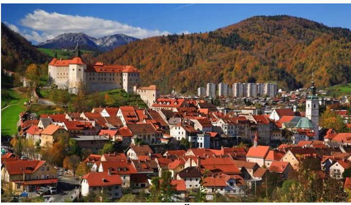
staro mesto Škofja Loka