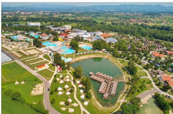
turistično naselje Čatež