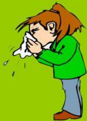
Ich habe Schnupfen