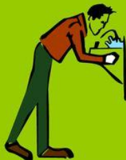
Ich habe Durst