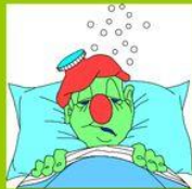
Ich bin krank