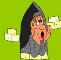
Ich bin müde