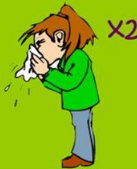
Ich habe eine Grippe