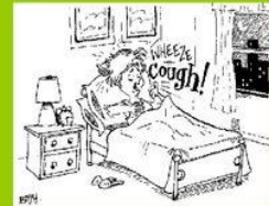
Ich habe Husten