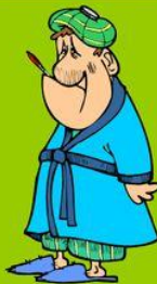
Ich habe Fieber