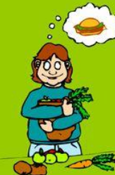
Ich habe Hunger